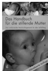
Das Handbuch für die stillende Mutter Fr. 24.–