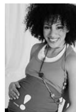
Diverse Bekleidungsartikel für Schwangerschaft, Mutter und Kind

Preise exkl. Versandkosten Info: shop.stillberatung.ch , Kontakt: versand@stillberatung.ch