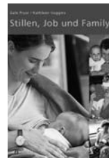
Neu: Stillen, Job und Family Fr. 24.50