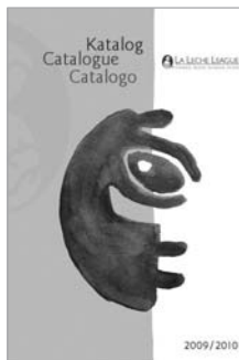
Katalog La Leche League-Shop Schweiz – kostenlos zu erhalten unter shop.stillberatung.ch oder 041 486 26 25