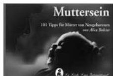
Muttersein, 101 Tipps für Mütter von Neugeborenen Fr. 14.–