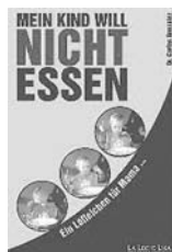
Div. Bücher für Kinderernährung, -Begleitung, -Pflege